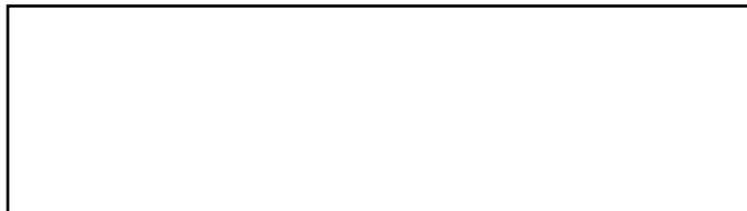
Foto van aanvrager Recent en heel gelijkend In kleur 45 X 35 mm Lichte egale achtergrond Foto moet tekst bedekken maar mag randen van kader niet bedekken

Niets boven deze lijn schrijven (behalve handtekening).